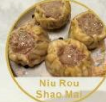
Niu Rou Shao Mai