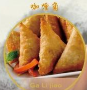
咖喱角 Ga Li Jiao 16. Frittierte Samosa Die würzigen Teigtaschen mit Curry Füllung 3 Stk., 9.-