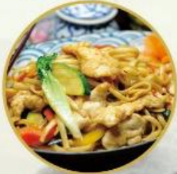
803. Gebr. Eier-Nudeln nach Hong Kong Art