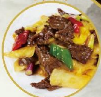
202. Gebr. Rindfleisch mit Thai Basilikum 26.-