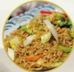
804. Gebr. Reis nach Cantonesischer Art