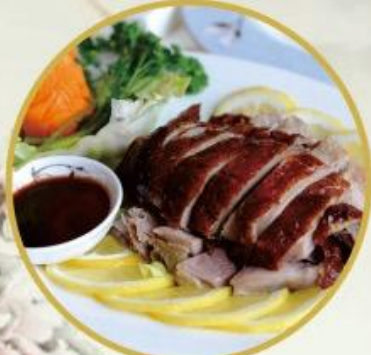
401. Knusprige Kantonische Ente 30.-