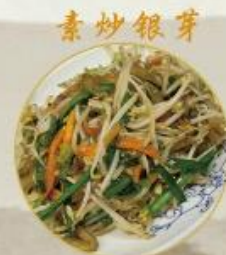
素炒銀芽 707. Gebratene Soja Sprossen 18.-