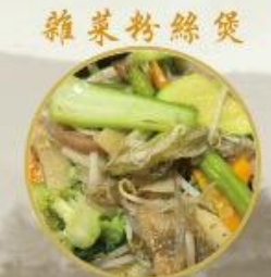
雜菜粉絲煲 708. Gemischte Gemüse Topf mit Glassnudeln (Glutenfrei) Topf 24.-