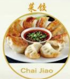
菜餃 Chai Jiao 14. Chin. Gemüse Ravioli 4 Stk 16.-