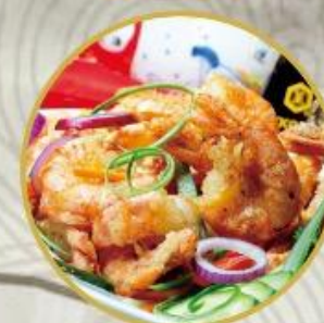
501. Riesen-Crevetten mit schwarzen Pfeffer 30.-