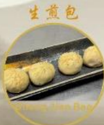
生煎包 Sheng Jian Bao 18. Gebratene Bao mit Schweinefleisch 4stk 16.-