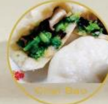
Su Cai Bao