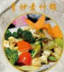
青炒素什錦 703. Chop-Suey (gemischtes Gemüse) 18.-