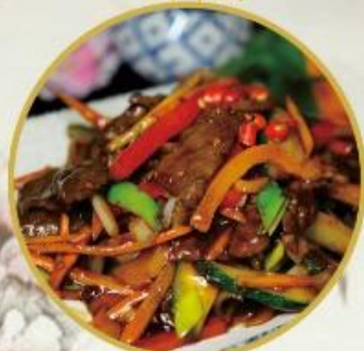
201. Rindfleisch Szechuan (scharf) 26.-