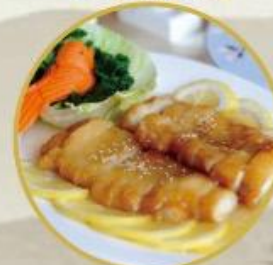
105. Poulet an Zitronen-Sauce Wir verwenden Schweizer Poulet- brust aus gutem Qualität, damit auch gut geschmeckt. 26.-