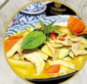
103. Grüne Thai-Curry mit Poulet (scharf) 26.-