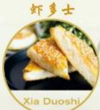
蝦多士 Xia Duoshi 15. Frittierte Crevetten Toast 2 Stk., 12.-