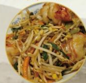
505. Gebratene Soja Sprossen mit Crevetten 30.- (leicht Scharf)