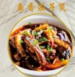
魚香茄子煲 705. Japanische Aubergine Topf 24.-