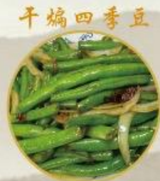
干煸四季豆 706. Gebratene Grüne Bohnen 16.-