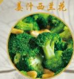
姜汁西兰花 701. Broccoli gebraten mit Ingwersaft 16.-