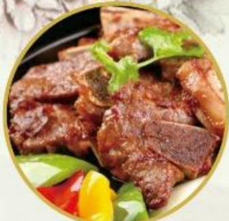
203. Gebr. Rindfleisch auf Hesseplatte nach Sizzling Art 30.-