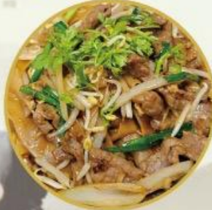
805 Gebratene Reis Nudeln mit Rindfleisch nach Hong Kong Art

Diese Gerichte ist sehr bekannt in Hong Kong u seit 2er Weltkrieg.