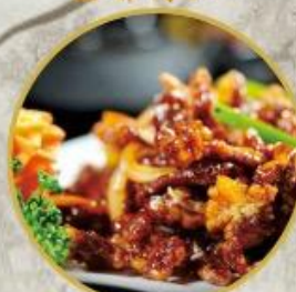
302. Knuspriges Schweinefleisch Streifen nach Peking Art 26.-