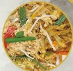
802. Thailandisches Phat Thai

Ist ein traditionelles Nudelgericht der thailändischen Küche. Es besteht hauptsächlich aus Reisbandnudeln, hinzu kommen verquirlte Eier, Fischsauce, Tamarindenpaste, gehackte Knoblauchzehen, Chilipulver, Mungbohnen sprossen.