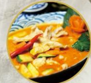
104. Rotes Thai-Curry mit Poulet (scharf) 26.-