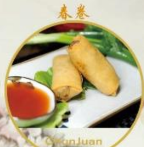
春卷 Chun Juan 10. Frühlingsrolle vegi ohne Fleisch 2 Stk., 8.-