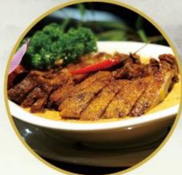
402. Rotes Thai-Curry Ente 30.-