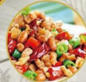
102. Poulet Kung Bao (scharf) 26.-