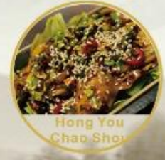
Hong You Chao Shou