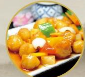
106. Poulet süß sauer 26.-