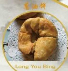
蔥油餅 Long You Bing 12. Pfannkuchen mit Frühlingszwiebeln 2 Stk., 10.-