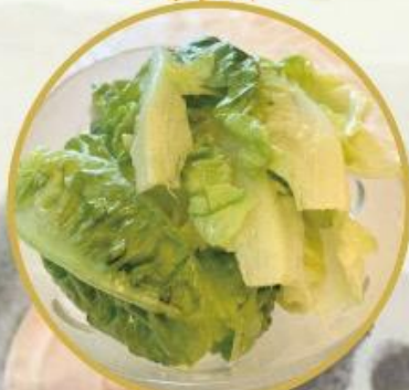
32. Grüner Salat mit Yuzu Sauce 7.-