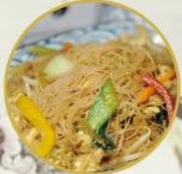
801. Gebr. Reis-Nudeln nach Singapore Art

Mit ihrem charakteristischen gelben Farbstoff und Currygeschmack sind Singapur-Bratnudeln eine gelungene Abwechslung zu klassischen gebratenen Nudeln.