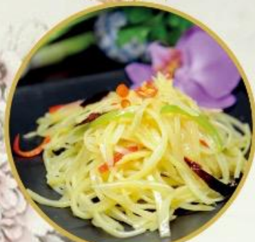
30. Papaya-Salat (scharf) 13.-