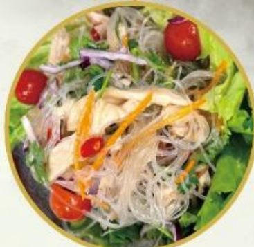
31. Glasnudel-Salat 10.-