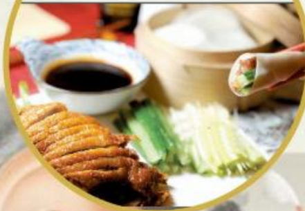
403. Mini Peking Ente Das Fleisch wird in gleichmäßige Rauten geschnitten und in zusammengerollten sehr dünnen Pfannkuchen mit einer speziellen Sauce (Hoisin Sauce). Dazu mit Gurken und Lauch. 40.-