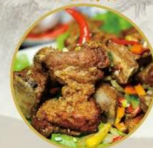
303. Spareribs mit Salz & Pfeffer zum Würzen und Verfeinern 26.-