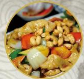
101. Poulet mit Cashewnüsse 26.-