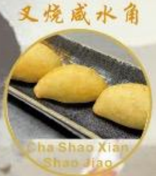
叉燒咸水角 Cha Shao Xian Shao Jiao 17. Cha Siu Teigtaschen 4 stk 16.- Reismehl Teigtaschen mit BBQ Schweinefleisch