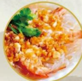
504. Gedämpfte Riesen-Crevetten mit Glasnudeln und Knoblauch 30.-