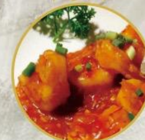
503. Riesen-Crevetten an süß und scharf Sauce 28.-