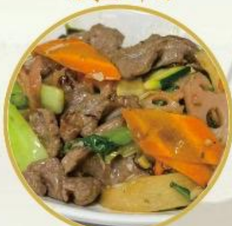
205. Gebratene Rindfleisch mit Salson Gemüse 26.-