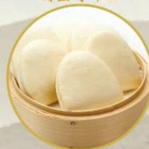
304. Gedämpfte Brot 4Stk 7.-