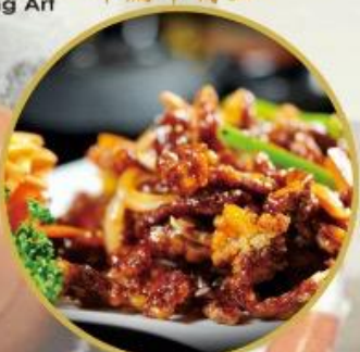
204. Knuspriges Rindfleisch Streifen An süß sauer und scharfe Sauce 30.-