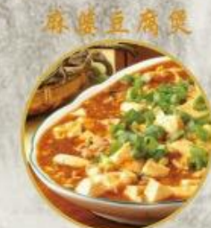
麻辣豆腐煲 704. Mapo Tofu Topf Mit weicher Tofu Würfeln (Pikant) Der Name Mapo Tofu bedeutet „Tofu nach Art der pockennarbigen gross Mutter“ 24.-