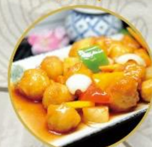
301. Schweinefleisch süß-sauer Süß-saures Schweinefleisch ist der Protagonist der traditionellen chinesischen Küche 26.-