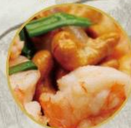
502. Crevetten gebraten mit Cashews Nüsse 30.-