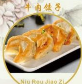
牛肉餃子 Niu Rou Jiao Zi 13. Gebratene Rindsfleisch Ravioli 4 Stk 16.-