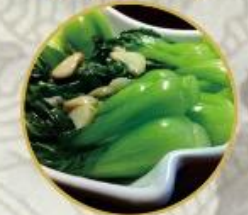
蒜香小白菜 702. Wok Pak Choi 16.-